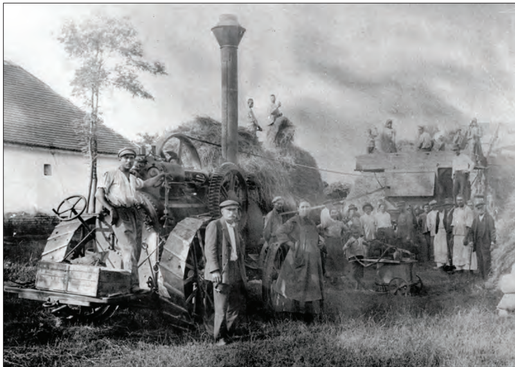
Parna vršalica