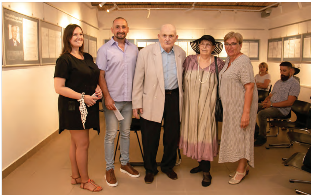
Akademik Ivan Gutman sa saradnicima

– Ovo je prvi put da u Muzeju prikazivamo dilo jednog svitskog naučnika. Mislim da Muzej i jeste mesto di treba bilužit dostignuća svi naši sugrađana. Želja akademika Gutmana bila je, upravo to da se povodom Dana nauke pripravi izložba o „Somborskom indeksu” zafaljujuć kojem je ime Sombora postalo pojam u svitskoj nauki – naglasila je Milka Ljuboja , kustos Varošskog muzeja u Somboru i autorka izložbe „Somborski indeks akademika Ivana Gutmana” koja je, povodom