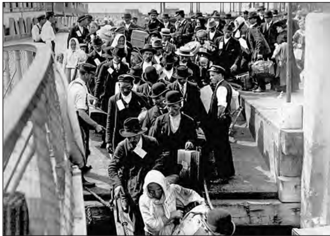
Dolazak useljenika prispili brodom iz Evrope

no, sa namirom iseljenika da se posli četiri el pet godina provedeni u SAD vrata kući. Mnogi od nji vratili su se i ranije, brez značajnije uštedevine.