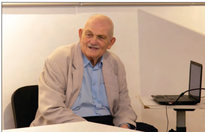
Akademik Ivan Gutman

Dana nauke, otvorena u depandansu Varošskog muzeja u Somboru.