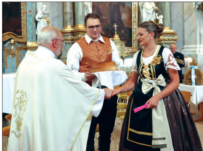
Na misi zafalnici posvećen je kruz od novog žita

– Somborska bunjevačka „Dužionica“ ima brojne posebnosti i od ovaki iskustava se uvijek mož